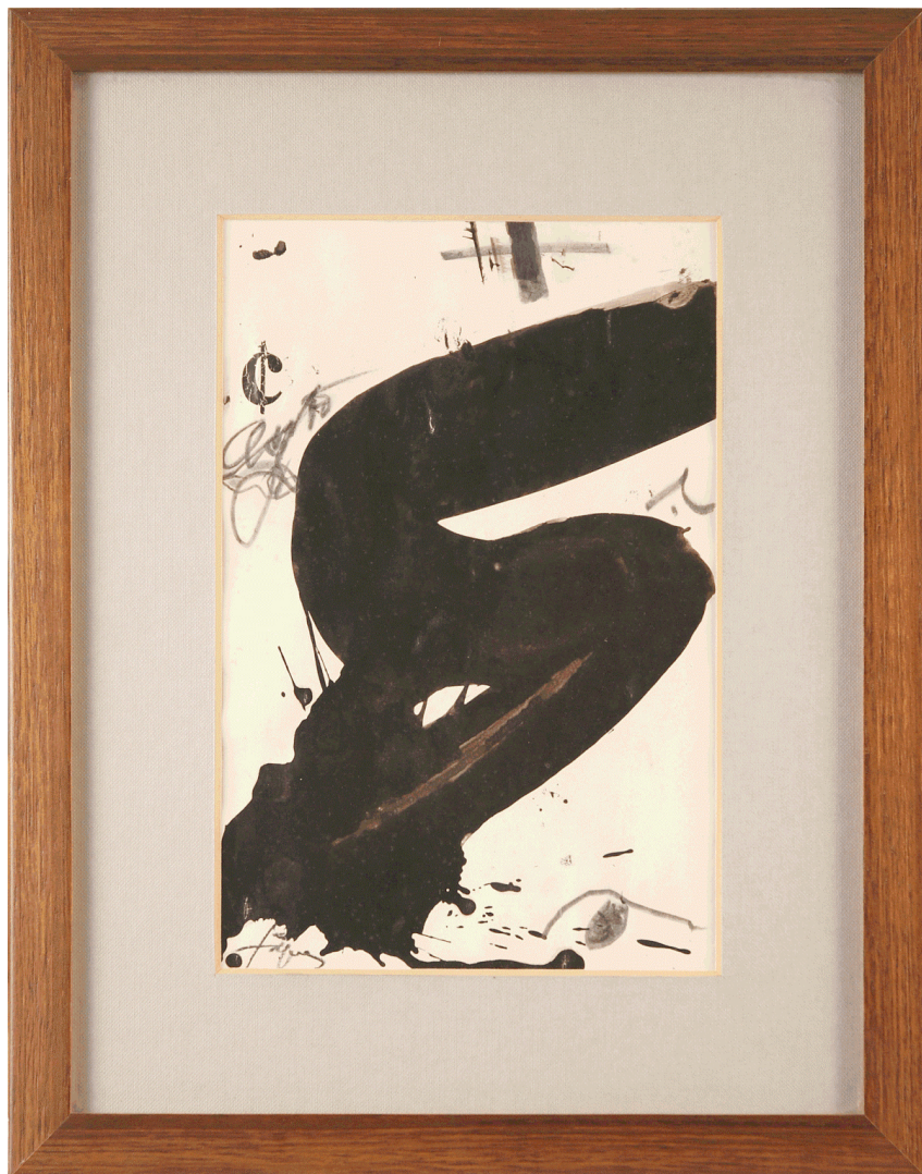
Fig. 2: Sense títol, s.d. © Fondation Antoni Tàpies Barcelona / VG Bild-Kunst, Bonn 2013

La segona de les obres (fig. 2), de 36 x 28'3 cm, és com un gran signe semblant a una S , en tinta negra sobre fons blanc, amb altres signes menuts i en negre també (com una ç , una r i una creu –les permanents creus de