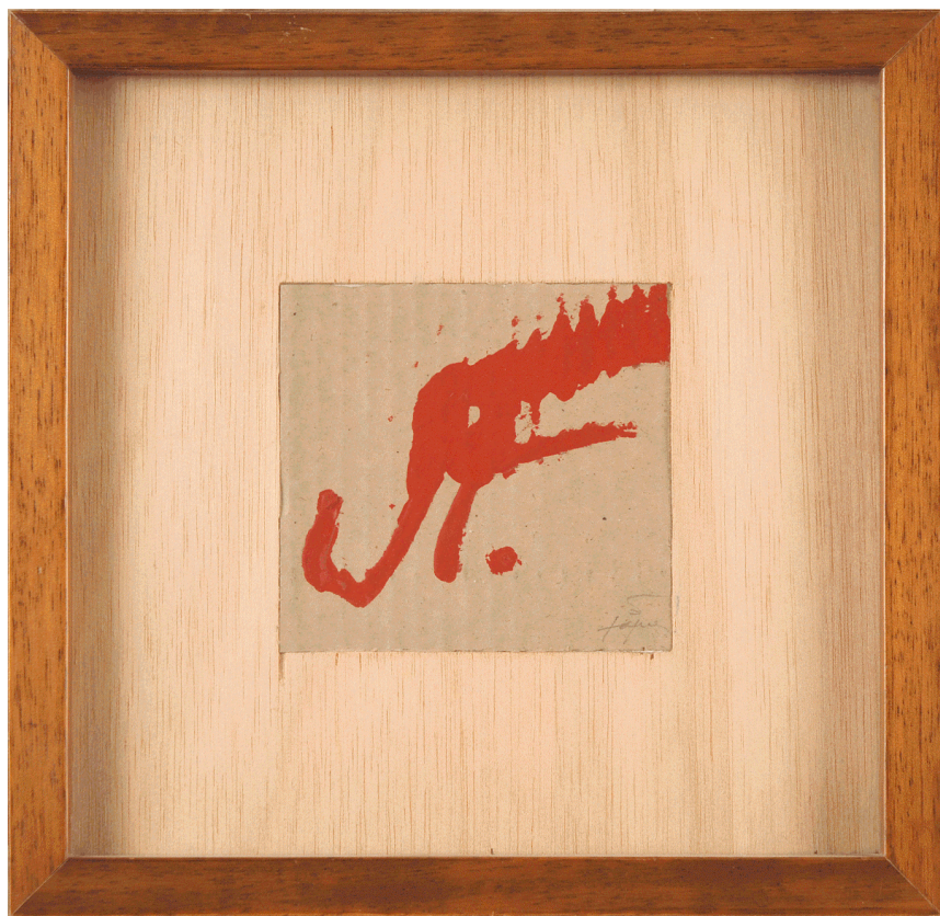
Fig. 1: Dibuix per a portada d'un llibre , s.d.

La primera d'aquestes peces (fig.1), de 22'7 x 23'2 cm, és una pintura sobre cartró, en roig sobre fons marró, sense dedicatòria ni data i, com indica el títol, fou la portada que va acompanyar un llibre. Aquest llibre era de Fuster i s'intitulava Contra el noucentisme , editat per Editorial Crítica, Bar-