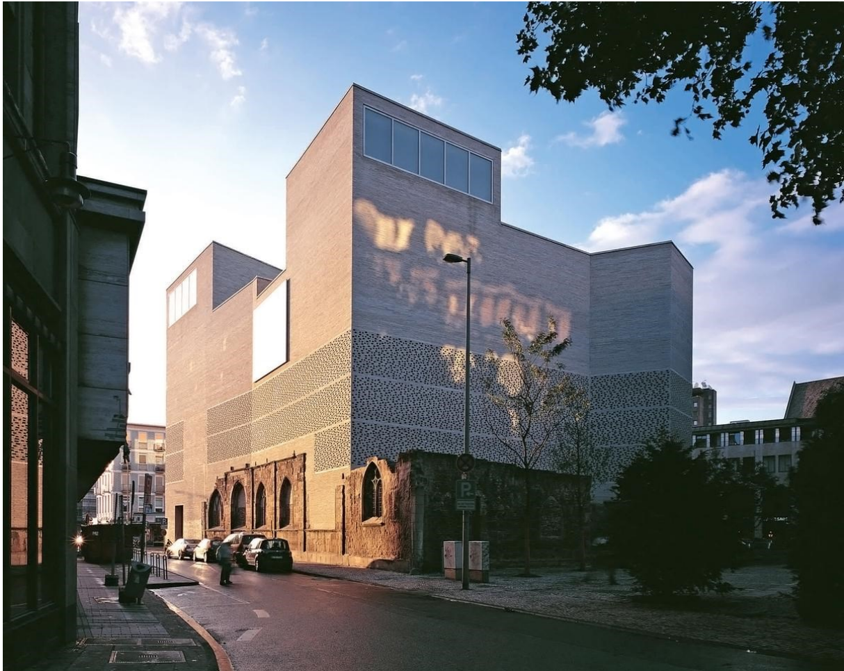
Abb. 1: Das Kolumba in Köln, Außenansicht.

Haupteinkaufsstraße von Köln, befindet sich der dezente, aber eindrucksvolle Neubau.