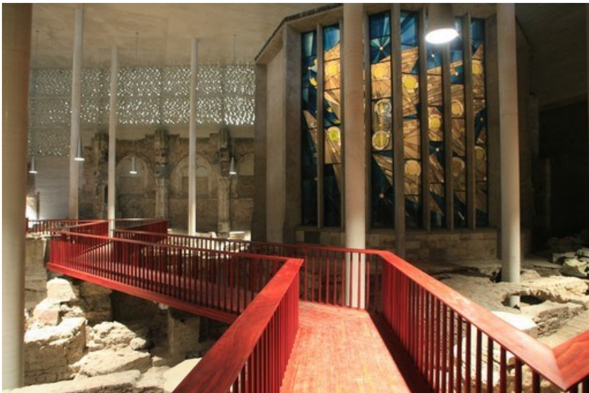
Abb. 3: Ausgrabung mit hölzernen Steg, Foto: LRZ, Unipor, München.

chen. Die Nord-, Ost- und Südtürme (Raum 17, 19 und 21) werden durch schmale Fenster am oberen Ende der Wand beleuchtet und stechen durch ihre beeindruckende Höhe sowie Akustik hervor. Die Eigenpräsenz der verwendeten Materialien stellt eine Besonderheit dar. Obwohl die sorgsam ausgewählten Baustoffe darauf bedacht sind, nicht in das kuratorische Konzept einzugreifen und daher sehr schlicht sind, ist das Zusammenspiel der Materialien das Ergebnis wohldurchdachter und ökonomischer Bedingungen. Der weiße Terrazzoboden, der sich durch die Haupträume des Kolumba zieht, wird durch gräulichen Jurakalk und Mörtel in den Nebenräumen abgelöst. Die Wände sind mit einem naturfarbenen Lehmputz überzogen, der farblich in den Boden übergeht. 6 Eine Ausnahme stellt das Lesezimmer (Raum 22) im zweiten Obergeschoss dar, welches mit einem naturbelassenen Holz vertäfelt wurde und nicht die Funktion eines Ausstellungsraumes einnimmt, sondern die eines Studiensaaes. Zumthors Neubau umfasst ebenfalls die Ruine der alten Kolumba-Kirche, deren sichtbare Überreste in der östlichen Fassade integriert wurden. Im Erdgeschoss befindet sich die ehemalige Sakristei (Raum 4). Die Ausgrabungen wurden in einer hohen Halle umbaut und lediglich ein hölzerner, gezackter Steg führt über die Ruine der 1000-jährigen Kolumba-Geschichte. 7